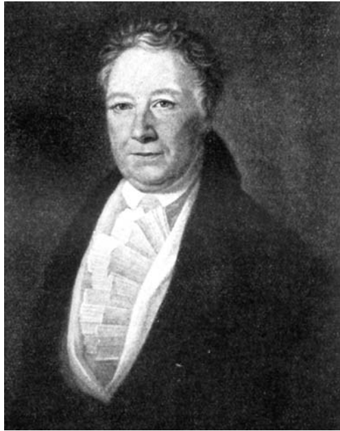
Georg Joachim Göschen