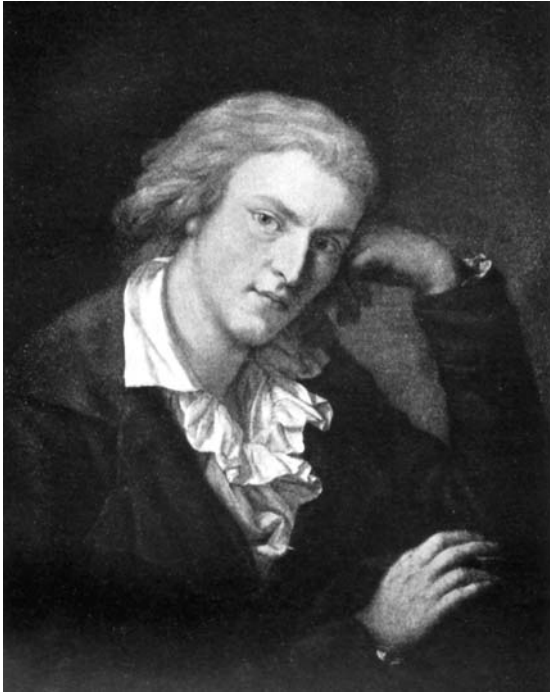
Friedrich Schiller im Jahre 1786 (Gemälde v. Anton Graff)

1788 in den Druck gegeben, fand allgemeinen Beifall und machte den Dichter nun auch als einen Historiker bekannt. Für seine Ernennung zum Professor der Geschichte in Jena kam es gerade zurecht und hat dafür wohl mit den Ausschlag gegeben.