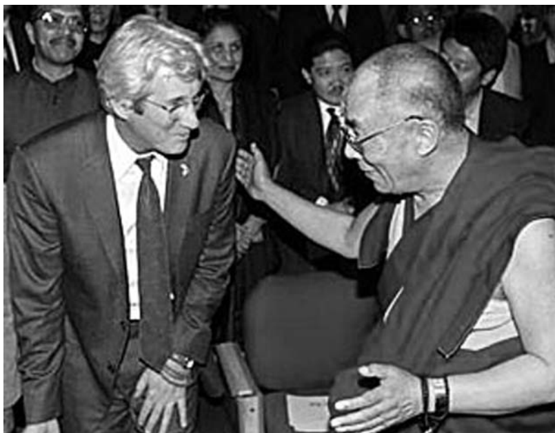
Filmstar Richard Gere mit Dalai Lama