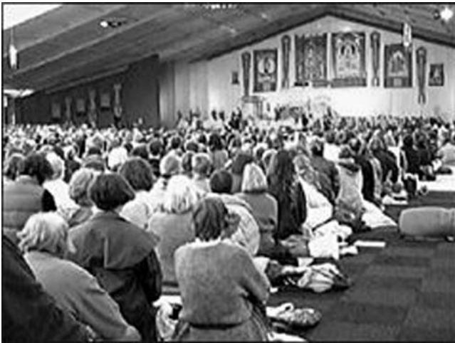
Besuch des Dalai Lama in Schneverdingen/Lüneburger Heide 1998