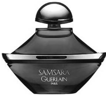
Parfum „Samsara“ von Guerlin

die junge Generation – auf der Suche nach alternativer Lebensgestaltung – den Antimaterialismus , die Friedfertigkeit fernöstlicher Religiosität und mithin den Buddhismus. Um dieselbe Zeit befanden asiatische Mönche und Meditationslehrer, daß nun die Zeit reif sei, verstärkt Europa zu missionieren. Eine Saat war aufgegangen! Und es schien sich die vielzitierte Weissagung des Padmasambhava 2) erfüllt zu haben, des Missionars, der die Lehre des Buddha im 8. Jahrhundert von Indien nach Tibet brachte. Padmasambhava hatte geweissagt: „ Wenn Eisenvögel durch die Luft fliegen, wird sich der Buddhismus nach Westen wenden. “