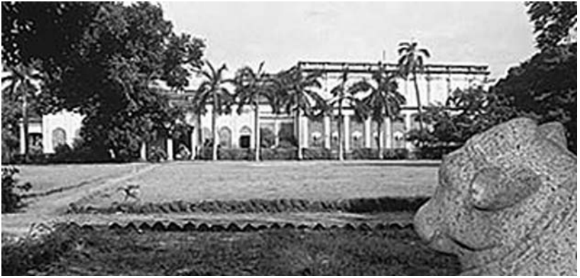
Sitz der Theosophischen Gesellschaft in Adyar, Indien