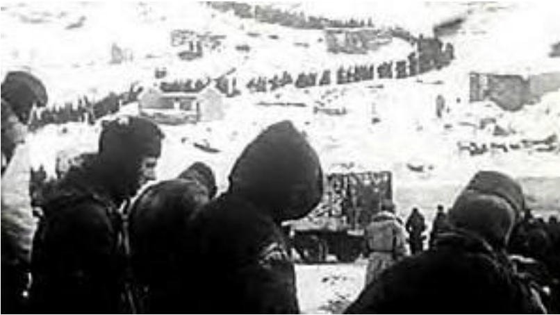
Abzug der 90 000 gefangenen deutschen Soldaten

In Vilsmaiers Film sind zum Schluß alle Soldaten der Sturmpannier-Kompanie gestorben oder gefallen. Nur einer von ihnen überlebt das Inferno. Entkräftet und von Halluzinationen gepeinigt, torkelt die zerlumppte Gestalt in einen eisigen Schneesturm hinaus, der über die endlose Steppe peitscht. Irgendwann bricht die kraftlose Gestalt vor Erschöpfung zusammen und bleibt einsam im Schnee liegen. Damit ist der Film beendet.