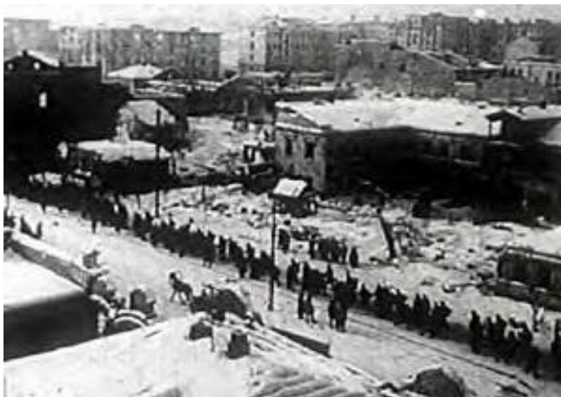
Deutsche Gefangene in Stalingrad

feldmarschall befördert. Doch Hitler tat diesen Schritt nicht ohne Hintergedanken. Keitel ließ er wissen: „Es gibt in der Kriegsgeschichte keinen deutschen Generalfeldmarschall, der in die Gefangenschaft gegangen ist.“ 21) Daß Paulus sich am Ende doch für das Leben und die Gefangenschaft und nicht für den Tod entschied, hat Hitler ihm nicht verziehen. Er könne keinen Respekt für einen Offizier empfinden, der sich lieber in Gefangenschaft begeben, als sich selbst zu erschießen. „Was gehört schon für eine Feigheit dazu, vor dem auch noch zurückzuschrecken.“ 22) Was der „Führer“ dabei vergaß: Das sinnlose Abschlachten der 6. Armee, die wiederholt verweigerten Ausbruchversuche, das Scheitern des Entsatzes waren nicht Paulus' Verantwortung. Der Armeeführer hatte bald nach der Einschließung darum gebeten, dem militärischen Irrsinn des Festhaltens an Stalingrad ein Ende zu bereiten, als die Sinnlosigkeit klar vor Augen lag. 23) Zu diesem Zeitpunkt wäre noch etwas zu retten gewesen.