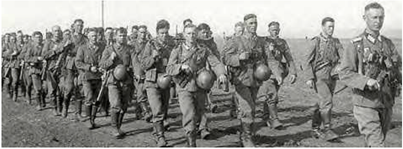
Soldaten der 6. Armee auf dem Marsch nach Stalingrad