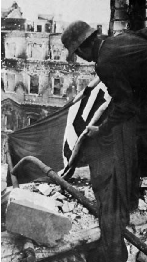
In einem zerstörten Haus wird die Fahne herausgehängt

Beide Seiten verschlissen sich bei diesem Patt weiter, ohne daß jedoch eine Seite den Mut gehabt hätte, die nutzlose Knochenmühle zu beenden. Die nationalsozialistische Propaganda verbreitete indes Siegesgewißheit und sah die Schlacht als bereits gewonnen an. Kein anderer als Hitler selbst sprach am 8. November 1942 im Münchner Löwenbräukeller jene fatalen Worte, die schon damals für den Oberbefehlshaber der Wehrmacht nach Kenntnis der militärischen Lage eine glatte Lüge waren: