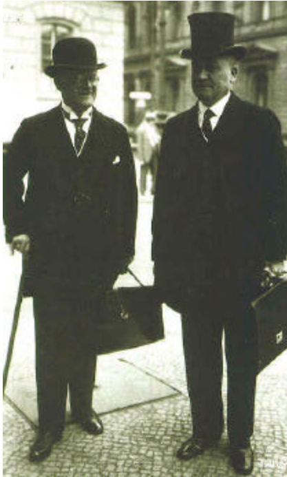
Ministerpräsident Held links im Bild

„Die Bestie ist gezähmt“, äußerte sich Held. In seiner Landtagsrede, mit der er die Wiederzulassung der NSDAP rechtfertigte, erklärte er, er habe Hitler gesagt, „daß ich ihm bei einer ordnungsgemäßen Agitation und Aktion nicht das geringste in den Weg lege, da ich selbst das lebhafteste Bedürfnis habe, daß namentlich unsere Jugend vaterländisch gesinnt und vaterländisch opferbereit sich zeige.“ 5)